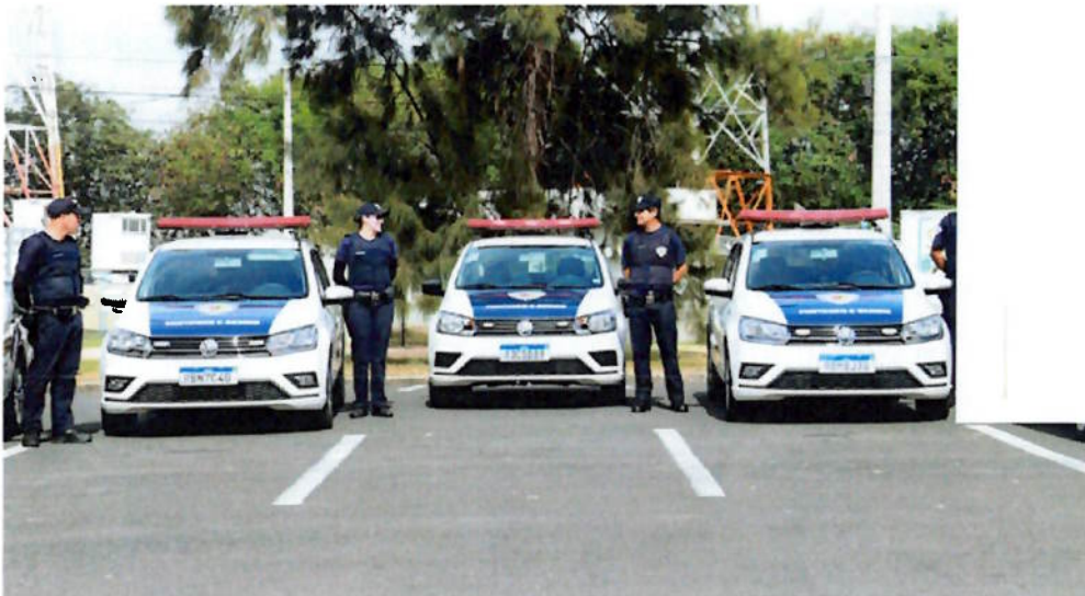
Aprovados no concurso vão assumir cargos da GCM Segunda Classe